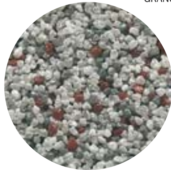
GRANUCOL® MIX 4