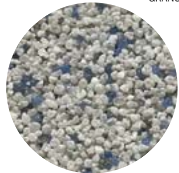
GRANUCOL® MIX 3