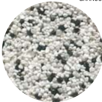
GRANUCOL® MIX 2